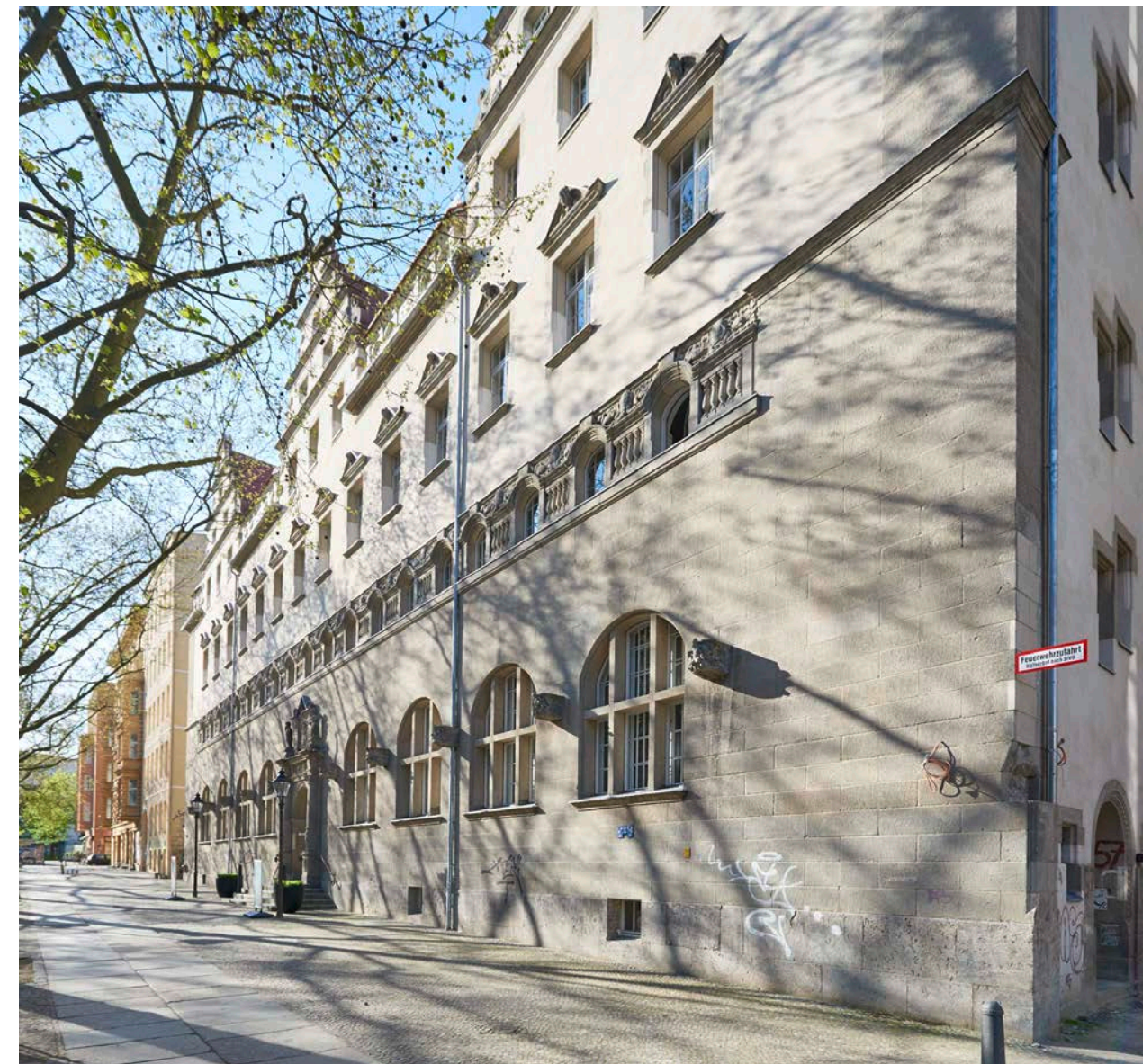
Das Stadtbad an der Oderberger Strasse: ein repräsentativer Bau im Stil der deutschen Neorenaissance.