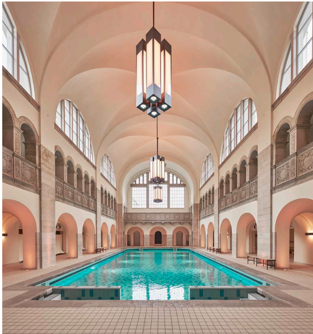
Prunkvolles Herzstück des Gebäudes ist die von einem Kreuzgewölbe überspannte Schwimmhalle.

halle. Sie gliedert sich in drei Ebenen und ist bis zum Kreuzgewölbe hin detailliert gestaltet. Im Erdgeschoss und 1. Obergeschoss rahmen Bogengänge die Längswände. In diesen Gängen befanden sich früher die Umkleidekabinen. Nach deren Rückbau wirkt die Halle noch grosszügiger. Riesige Bogenfenster auf der obersten Ebene und an der Südseite des Raumes sorgen für eine lichtdurchflutete und einladende Atmosphäre. Um bei der Sanierung der Fenster die ursprüngliche Anmutung zu bewahren und gleichzeitig modernen Wärmeschutzstandards zu entsprechen, entschieden sich die Architekten für eine Rekonstruktion mit den hoch wärme-