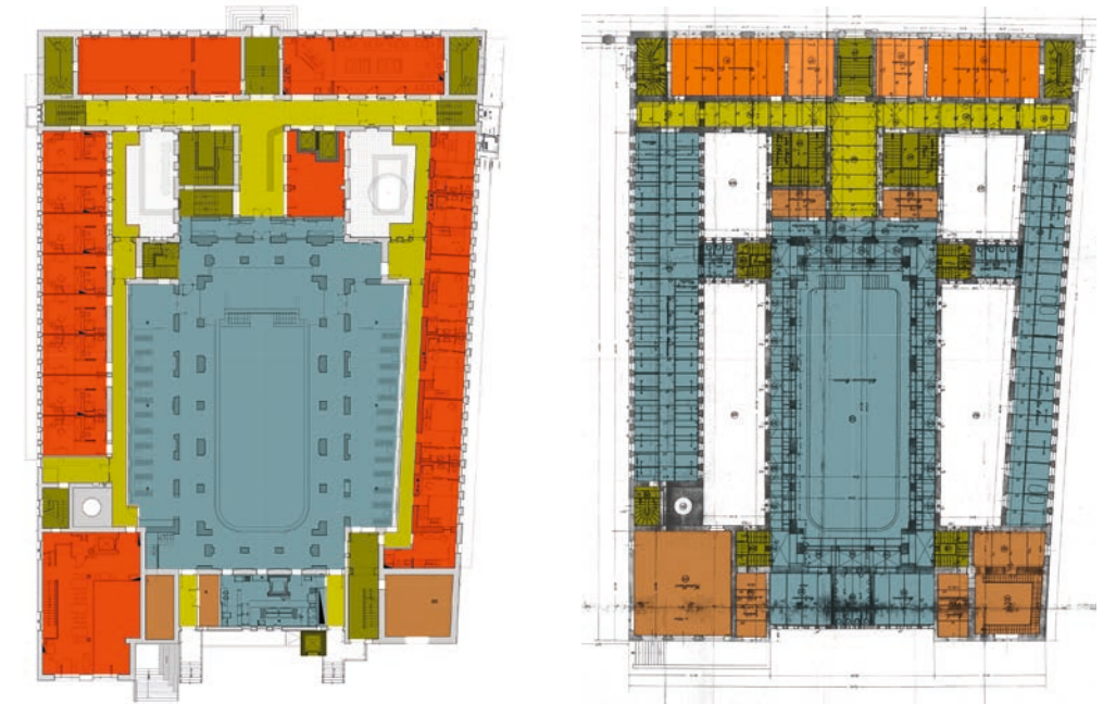
Bauantragsplan Grundriss Erdgeschoss, Nutzungskonzept von 2012.

Die Montage der grossen Fenster an der Südseite, bei denen die Sprossen aufgesetzt sind, gestaltete sich als besonders aufwendig. Hier bauten die Monteure von Metallbau Windeck zunächst den äusseren Rahmen, mit dem die Aussensprossen verschweisst waren, ein. Dann wurde die grosse Isolierglasscheibe eingesetzt. Um sie in Position zu bringen, musste der Hubarm von aussen zwischen